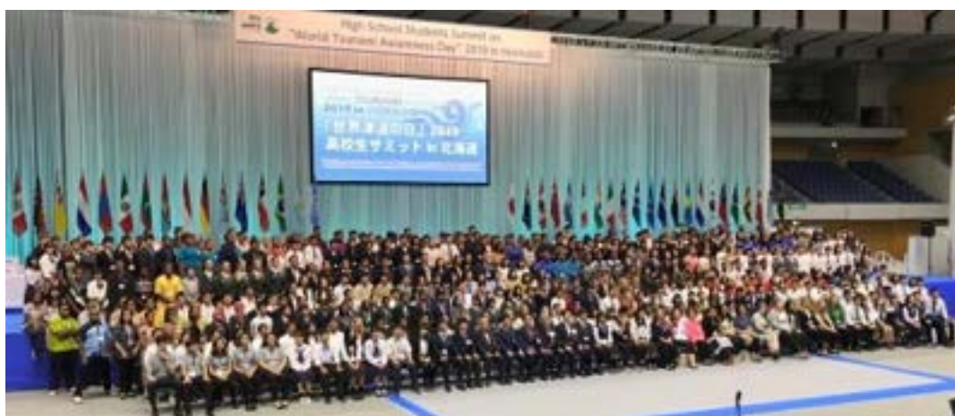
世界44ヶ国、約520名の参加者

サミットは全て英語で進行し、分科会でのディスカッションももちろん英語です。鯖江高校は日本国内の4校、ペルー、ニュージーランド、ベトナム、ソロモン諸島の高校生と同じ分科会となりました。各学校が災害から学ぶことについてプレゼンテーションを行い、高校生ができることについてグループディスカッションを行いました。ネイティブに英語を話す高校生もそうでない生徒も、協力しながらディスカッションをしている姿、そして一生懸命に自分の思いを伝えようとする本校の生徒たちの姿は感動的でした。