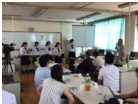
生産農家さんからのご高評