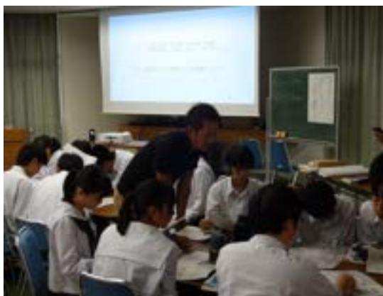
鯖江の自然堤防や扇状地をマーキングするグループ