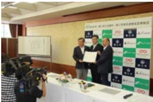
報道機関による記念撮影