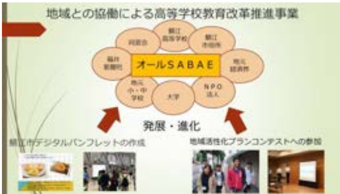
「地域との協働による高等学校教育改革推進事業」説明①

今後、生徒向けパネルディカッションや授業公開、全教科での地域連携などを通して学校全体で地域との協働に取り組んでいきます。