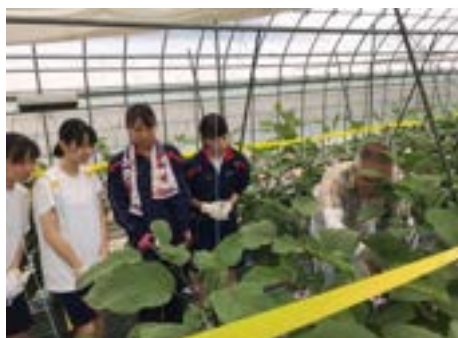
収穫体験で収穫方法を教えていただいている様子

7月18日（木）には、鯖江市役所農林政策課にご協力いただき、生産農家さんのビニールハウスで収穫体験も行いました。収穫の方法だけでなく、品種改良されていない「吉川ナス」独特の栽培の難しさなど、多くのことを学びました。