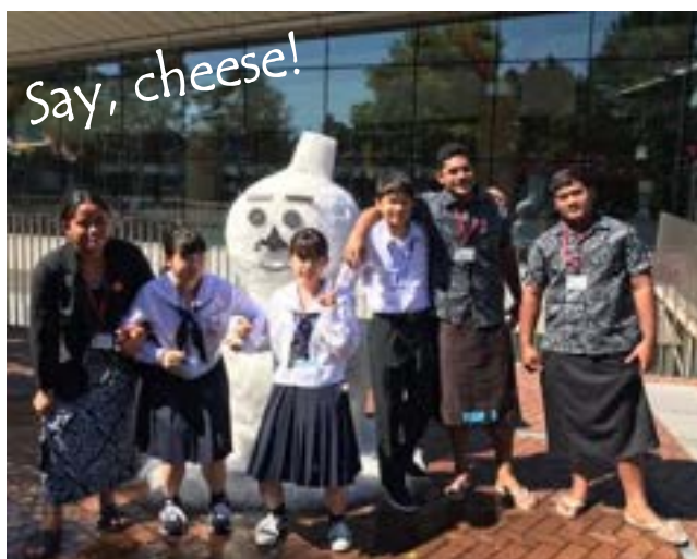
笑顔は万国共通のコミュニケーションツール！)

休憩時間やレセプションでは、臆することなく海外の生徒に積極的に話しかけ、写真を撮ったり連絡先を交換したりと、様々な国の高校生と親睦を深めることができました。