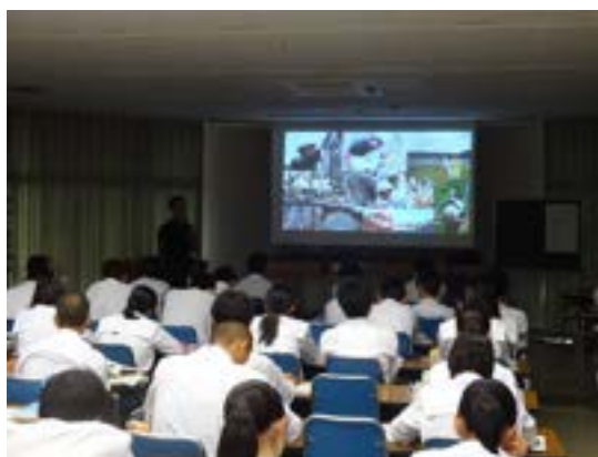
先生ご自身の体験エピソードも交えた講義の様子

その後グループに分かれて、昔の地図や図書、インターネットなどを活用して、鯖江の地図に特徴的な地形(自然堤防、扇状地、断層など)に色をつけたり、特徴的な地名からその語源を調べていく作業をしていきました。