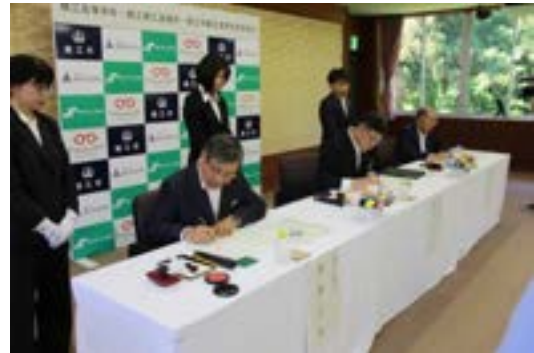
3団体代表者が署名

地域に根差した学校づくりを推進し、将来、地域で活躍する市民を育成するという目標の第一歩となりました。