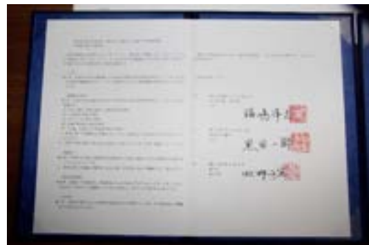
締結された相互連携協定書