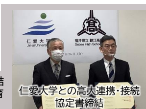
仁愛大学との高大連携・接続協定書締結

令和3年2月26日(金) 仁愛大学と、高大連携・高大接続に関する協定を締結しました。鯖江高校の生徒と仁愛大学の学生、教職員相互の交流によって、教育の質的転換と生徒や学生の着実な成長につなぎたいと考えています。