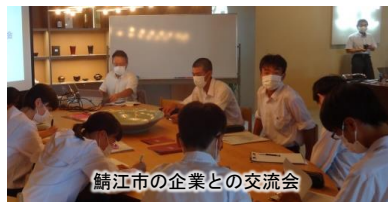
鯖江市の企業との交流会