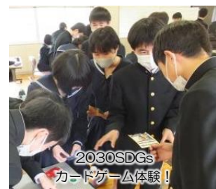
2030SDGsカードゲーム体験！