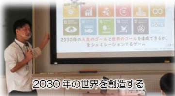
2030年の世界を創造する