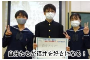
自分たちが福井を好きになる！