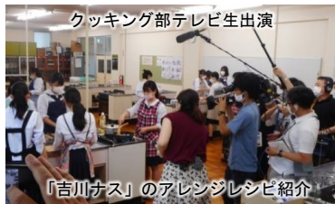
クッキング部テレビ生出演