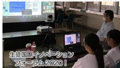
生徒国際イノベーションフォーラム2020！