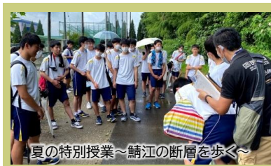
夏の特別授業～鯖江の断層を歩く

今年度は新型コロナウイルスの影響により、当初予定していた様々な活動ができない状況となりました。色々な制限があるなかで、感染症予防対策を講じながら実施可能な活動を模索し、地域人材を活用した多くの活動を、地域の皆さんのご協力を得ながら実施することができました。