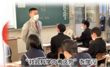
“社会科学の考え方”を学ぶ